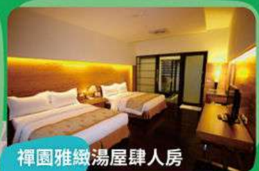
禪園雅緻湯屋肆人房