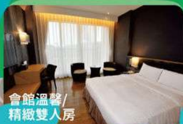
會館溫馨/ 精緻雙人房

注意事項： ● 平日定義：週日~週五。 ● 假日定義：週六及連續假日起始日至連續假日結束前一日。 ● 平、假日依官方網站公告平假日一覽表為準。 ● 本券若升等其他房型或假日使用請參考升等加價表。 ● 本券於農曆春節期間(依官網公告)視同現金券，供住宿折抵房價使用。 ● 本券超過優惠期間視同現金券，供住宿折抵房價使用。 ● 每人可加價200元，將紅藜肉燥飯簡餐升等為招牌套餐或合菜(四人以上)。