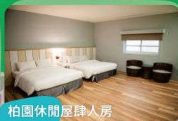
柏園休閒屋肆人房